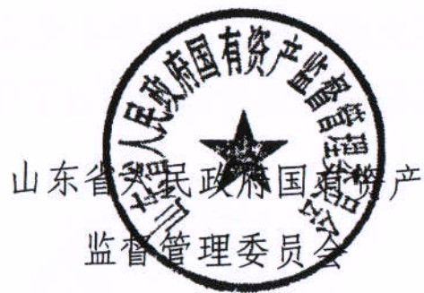
山东省人民政府国有资产监督管理委员会