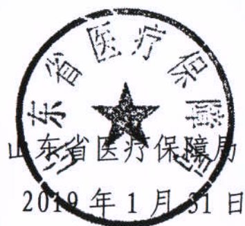
山东省医疗保障局